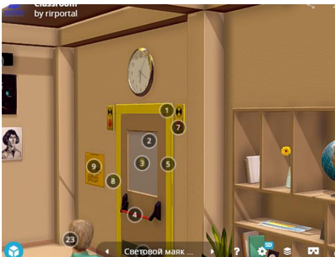
Рис.6. Модельное решение (входная группа)